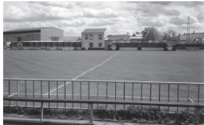
Hřiště v roce 2002

Zájem o kopanou byl tak velký, že bylo založeno i druhé mužstvo, které doplňovalo řady hráčů prvního mužstva, když se přihlásilo do sportovní soutěže IV. klasifikační třídy. Oficiální název klubu byl S.K. Dolní Bojanovice.