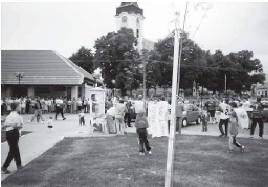
Náves obce po návratu z Rohatce

ce kopané v naší obci a blízkém okolí a na které mnoho fanoušků určitě nezapomeneme.