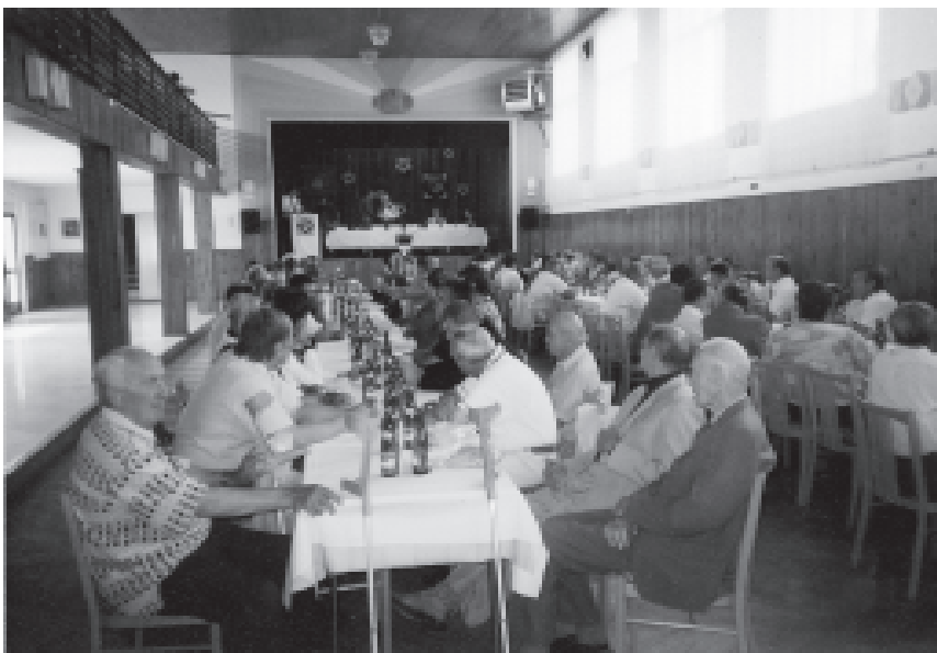
Rok 2001. Okresní fotbalový svaz. 100 výročí založení svazu.