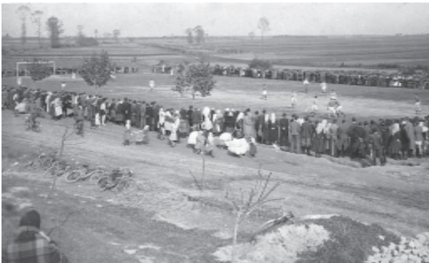
Pohled na hřiště z roku 1945