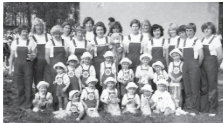
Spartakiáda Dolní Bojanovice, rok 1980