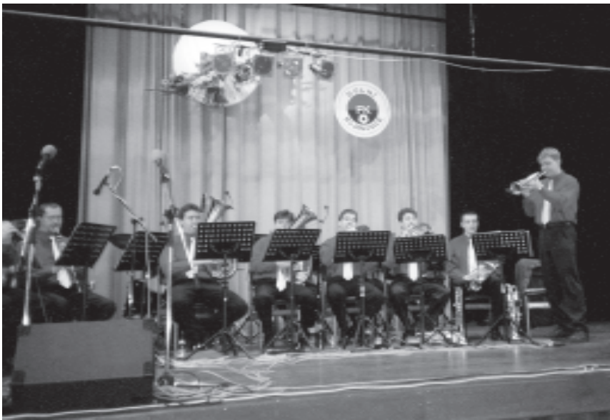
Ples sportovců 2002