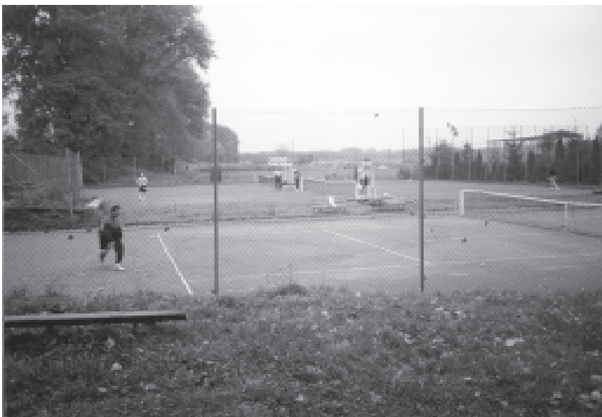
Areál tenisových kurtů