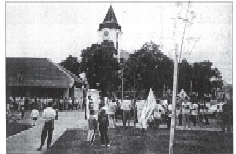
Centrum Bojanovic se zaplnilo lidmi u okrajích nedělního prázdného dne.